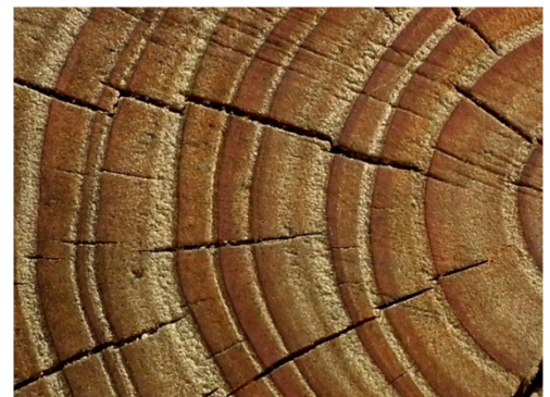
Baumringe fotografiert auf dem Waldlehrpfad Hohenwettersbach

Jahreszeiten und der Wuchs der Pflanzen waren für die Menschen wichtig, und wir können heute noch an den Pflanzen Informationen über das jeweilige Klima erhalten und natürlich auch darüber, wann etwas war (Radio-Carbon-Verfahren).