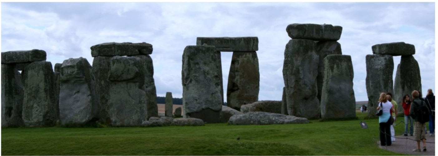
Sonnenobservatorium Stonehenge (vor circa 5000 Jahren)